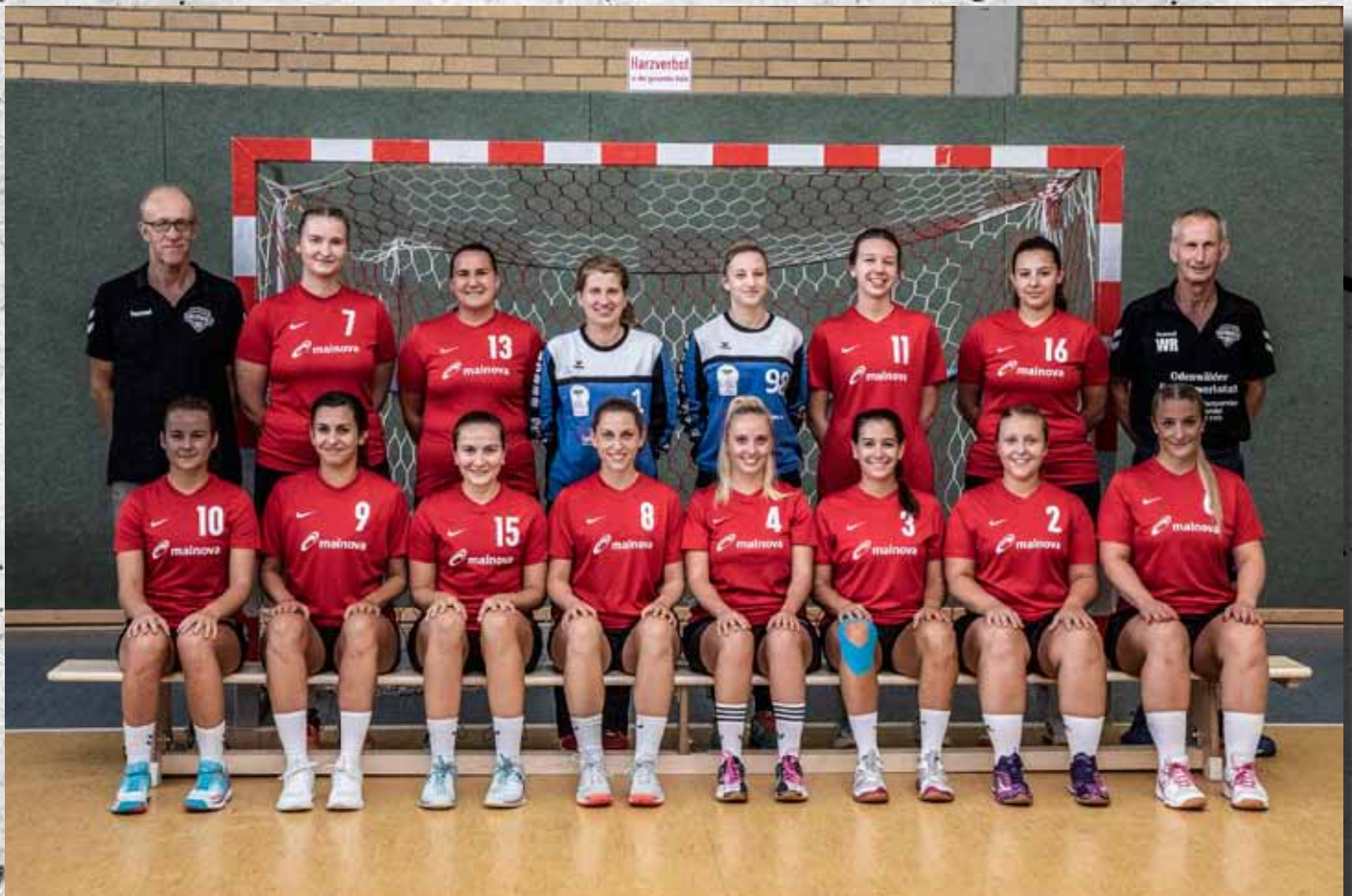
FSG Odenwald 2 (Bezirksliga A)