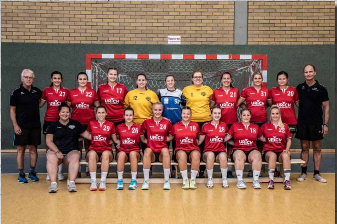
FSG Odenwald 1 (Landesliga)